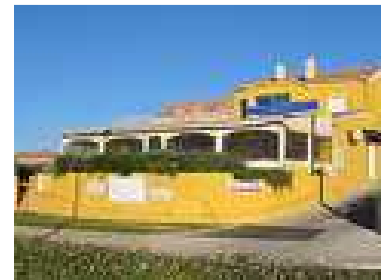
Restaurant la Corniche 941, Corniche de la Coudoulière 83140 Six-Fours-Les-Plages